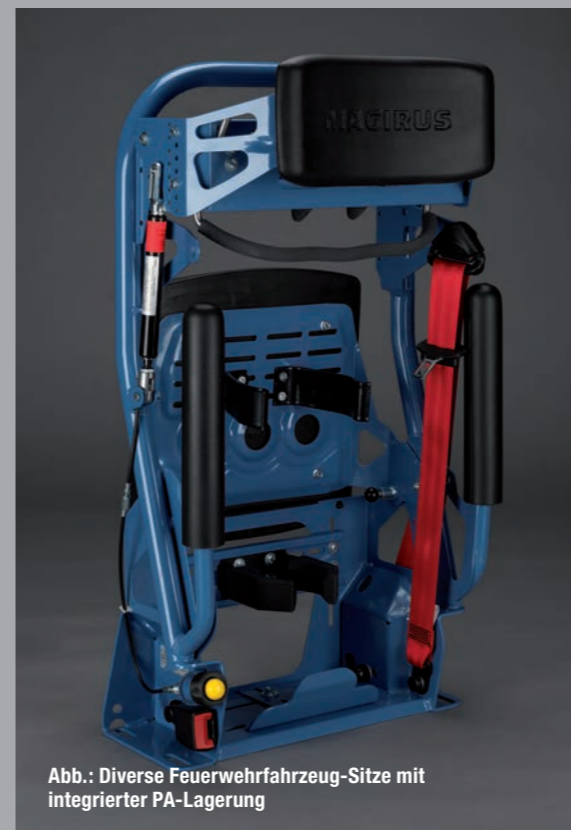
Abb.: Diverse Feuerwehrfahrzeug-Sitze mit integrierter PA-Lagerung