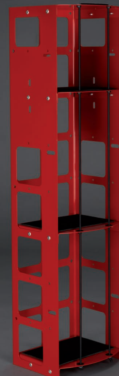
Abb.: Symbiose aus Filigranität, Stabilität, Praktikabilität – Maskenturm