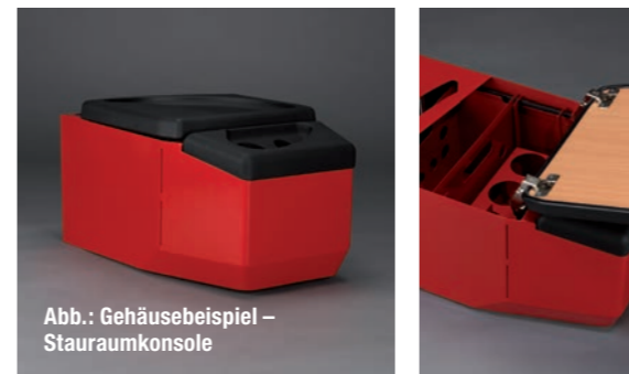
Abb.: Gehäusebeispiel – Stauraumkonsole

Von der Ablage über Maskentürme bis hin zu vielseitigen Schaltschrank- und Stauraumlösungen und vielem mehr – in unserem Gehäusebau schaffen wir Raum für Ihre Ordnung – stets durchdacht und immer basierend auf unserer Leichtbau-Kompetenz und Präzision designt.